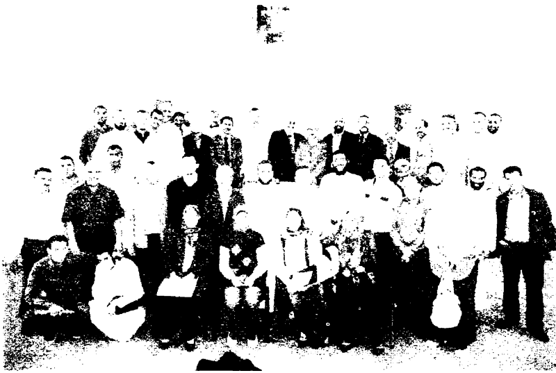
صورة جماعية بعد انتهاء الندوة